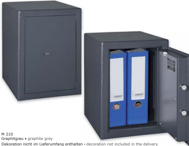
M 210 Graphitgrau • graphite grey Dekoration nicht im Lieferumfang enthalten • decoration not included in the delivery

Möbeleinsatztresor, Stufe B (VDMA 24 992, Ausgabe Mai 1995)* Furniture safe, Level B (VDMA 24 992, May 1995 edition)*