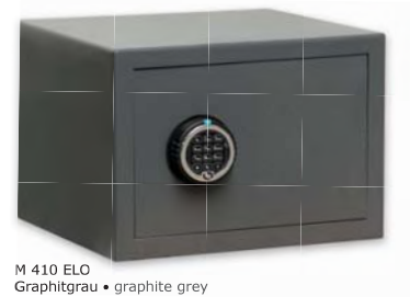
M 410 ELO Graphitgrau • graphite grey