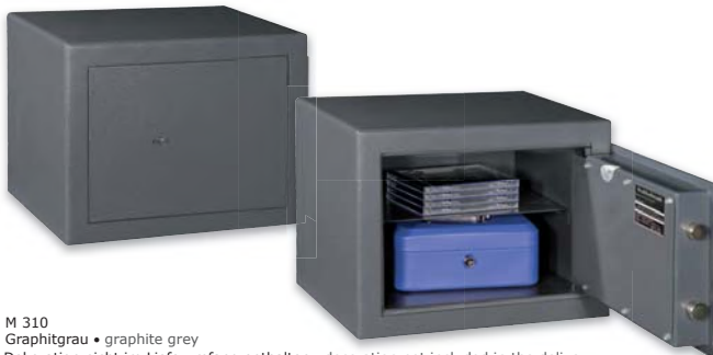
M 310 Graphitgrau • graphite grey Dekoration nicht im Lieferumfang enthalten • decoration not included in the delivery