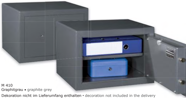
M 410 Graphitgrau • graphite grey Dekoration nicht im Lieferumfang enthalten • decoration not included in the delivery