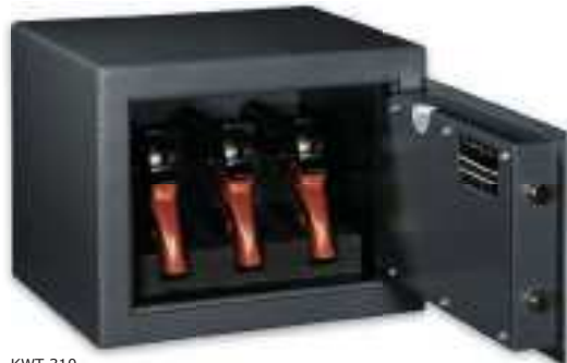
KWT 310 Graphitgrau • graphite grey Dekoration nicht im Lieferumfang enthalten • decoration not included in the delivery

Kurz-Waffenschrank, Stufe B (VDMA 24 992 - Ausgabe Mai 1995)* Handgun cabinet, Level B (VDMA 24 992 - May 1995 edition)*