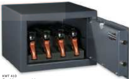
KWT 410 Graphitgrau • graphite grey Dekoration nicht im Lieferumfang enthalten • decoration not included in the delivery