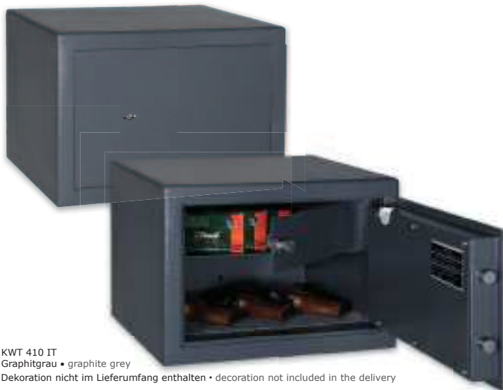
KWT 410 IT Graphitgrau • graphite grey Dekoration nicht im Lieferumfang enthalten • decoration not included in the delivery